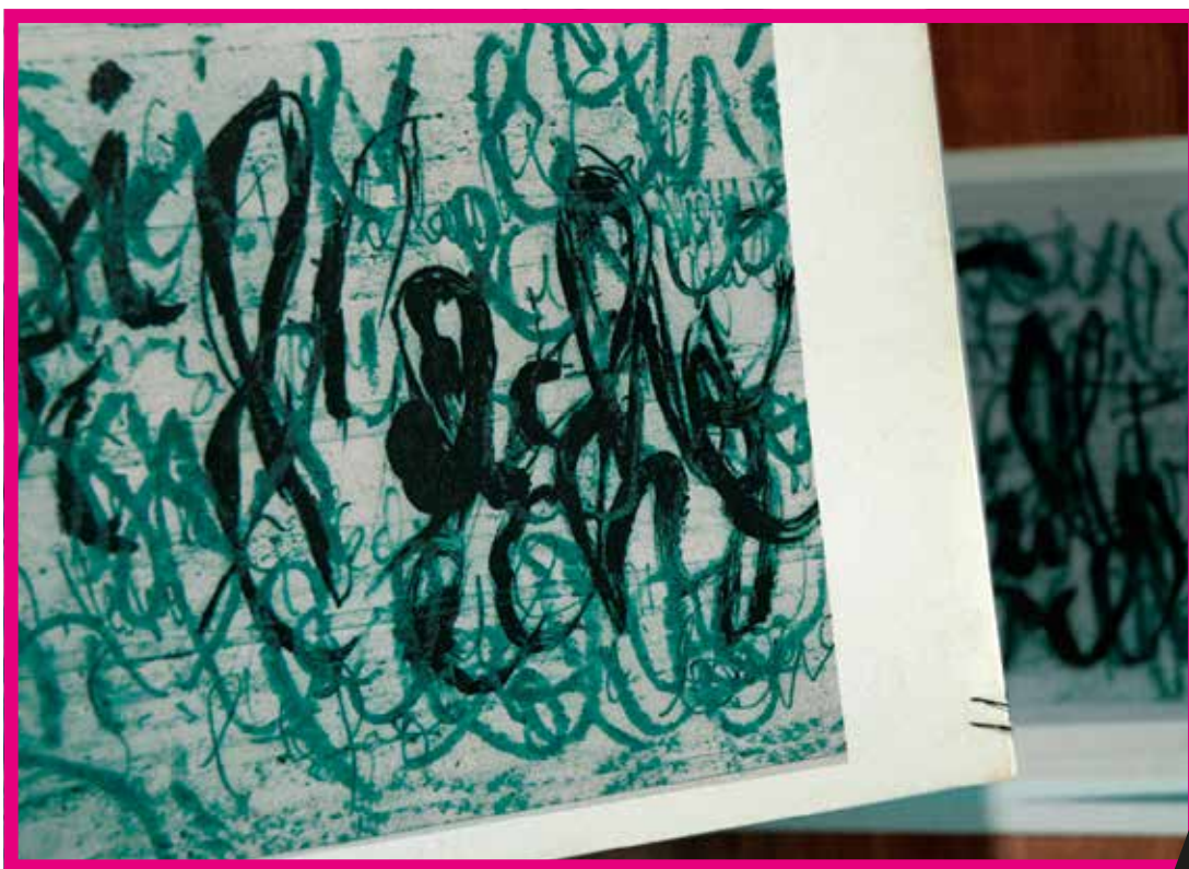
Nom de l'œuvre - Arno Azria

Parfois automatique, parfois maîtrisée, souvent instinctive telle est sa démarche plastique.