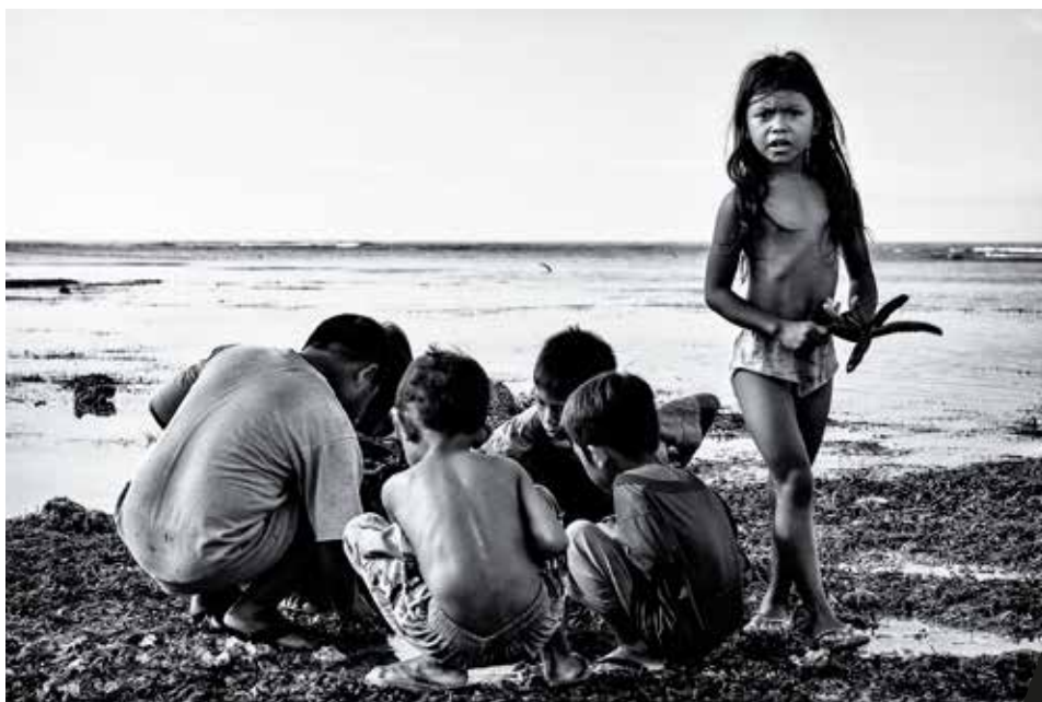
Nom de l'œuvre - Matteo Giachetti

Installé, depuis 2014 à Londres, il poursuit ses différentes activités photographiques et artistiques.