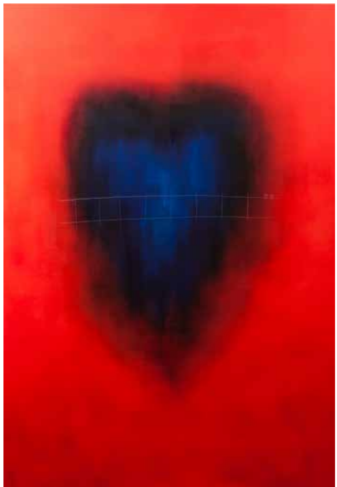
Nom de l'œuvre - Noémie Rocher

La porte des couleurs, chez Noémie Rocher, mène à la connaissance de soi dans la fusion des règnes : c'est la « porte-parole » du silence bruisant de la Nature et de nos émotions tues. Pour les chamanes, l'homme est le rêve de la plante. Noémie remonte le cours de ce rêve pour ouvrir nos yeux à la réalité d'un monde qui, à l'origine, ne nous voulait que du bien. Seul son aveuglement a décoloré l'homme.