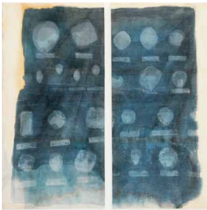
Nom de l'œuvre - Saïdia Bettayeb

Exposée depuis 2007, elle prépare deux expositions en Suisse et à Paris pour 2015.