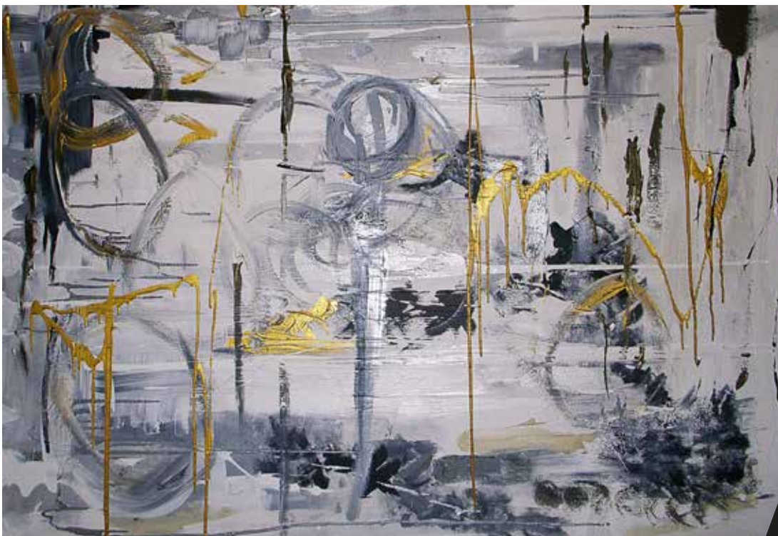
Nom de l'œuvre - Caroline Faindt