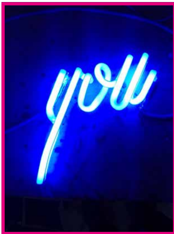
Nom de l'œuvre - Benjamin Joseph Cohen

Il dépeint depuis 2 ans le thème phénomène underground de la house music, dans sa ville mère, Ibiza.