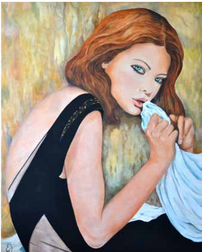
Nom de l'oeuvre - Elise James

Grâce à ces images glanées de part le monde et aux couleurs enregistrées, Elise James retranscrit ces instants de vie mémorisés qu'elle interprète au fusain, aux pastels ou à l'huile.