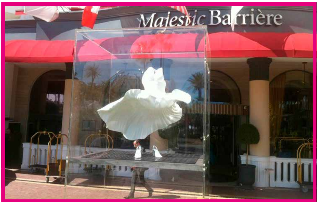
Nom de l'œuvre - Xanderlande

L'artiste plasticien Xanderlande a livré une sublime interprétation de la présence de Marilyn avec cette sculpture : la fameuse robe blanche du film «Sept ans de réflexion» figée en plein mouvement, intemporelle et vivante, avec ce travail autour de la réminiscence et de l'objet.