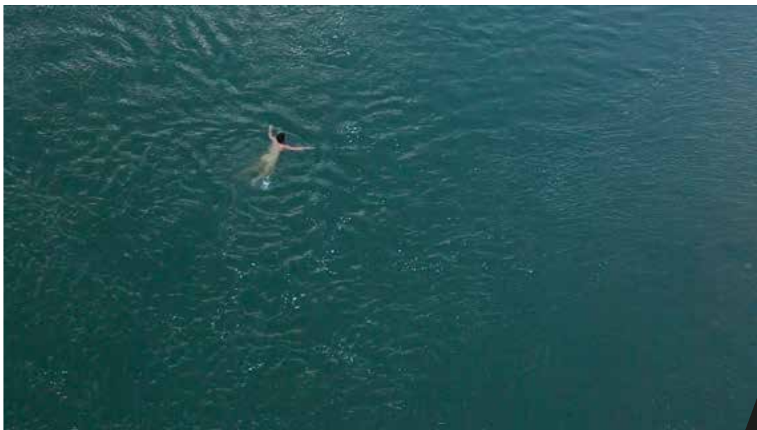
Vue d'ici - Pauline Lavogez

À travers ses installations, ses sculptures, ses vidéos et ses performances, Pauline Lavogez se questionne en permanence sur la limite des corps, individuel et collectif.