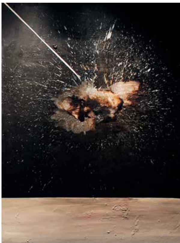
Nome de l'œuvre - Sophie Arama

Exposée depuis 4 ans, les œuvres de SophaR sont actuellement visibles à la Galerie Fabrice Diomard à Paris.