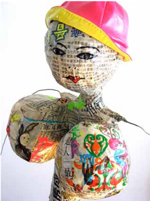
Nom de l'œuvre - Soÿ

L'univers de ses toiles ainsi créées donne naissance aux mots pour écrire des romans. Puis les mots remercient en offrant de nouvelles images. Sa démarche a avant tout pour but d'éveiller la curiosité, de transformer en nous la conception de l'univers, afin que chaque œuvre soit une fenêtre sur le monde.