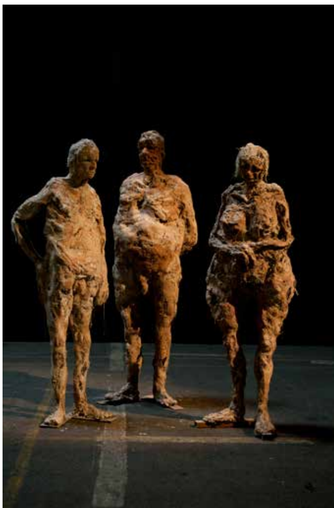
Nom de l'œuvre - Kéramsi