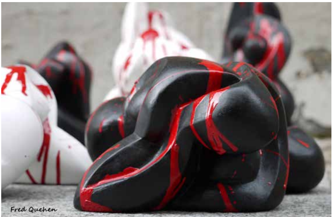
Nom de l'œuvre - Michèle Chast

Chez elle, créer, c'est une volonté, une interrogation, un acharnement, un effort pour atteindre une forme de sérénité. C'est une offrande. L'art devient une énergie, un moteur, un souffle, une métamorphose.