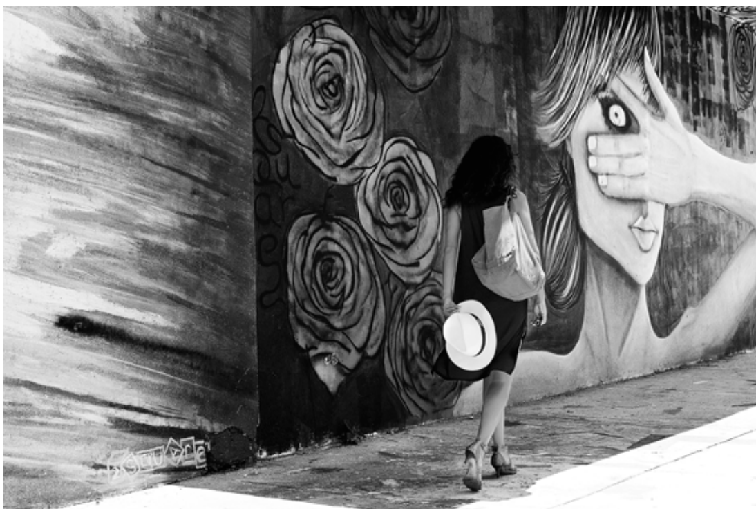
Nom de l'œuvre - Sarah Jehan

Appuyer sur le déclencheur sans être remarquée comme pour transgresser l'interdit, s'évader d'un milieu privilégié, pour créer une multitude d'instantanés, guidée par une envie de trouver quelque chose de vrai, de rendre éternel la préciosité de l'instant.