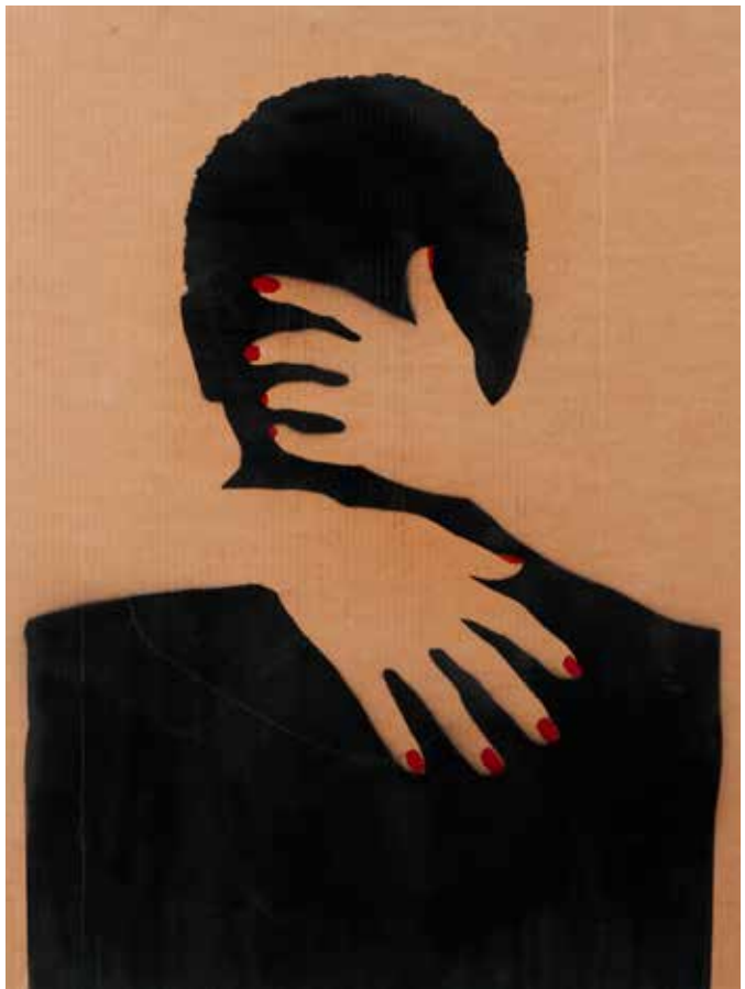
Nom de l'oeuvre - Monsieur B.

Ses oeuvres deviennent le fruit de plusieurs hommes qu'il n'oublie jamais de mettre en avant.