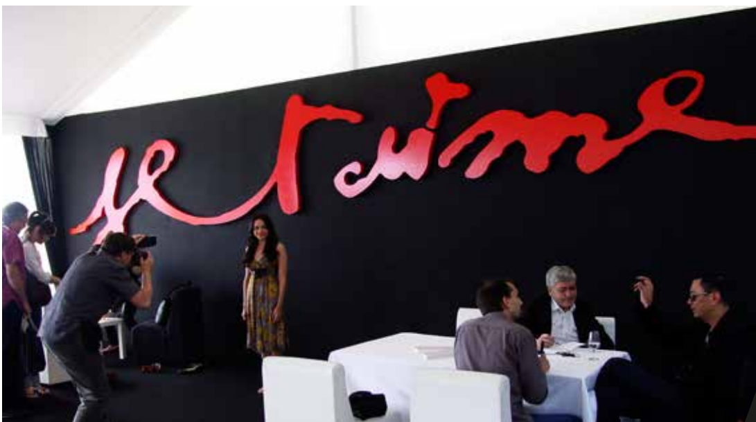
Je t'aime - SIGN7

« C'est un « Je t'aime » mausolée qui amalgame souvenirs et rêves, comme une allégorie des utopies » nous confie-t-il.