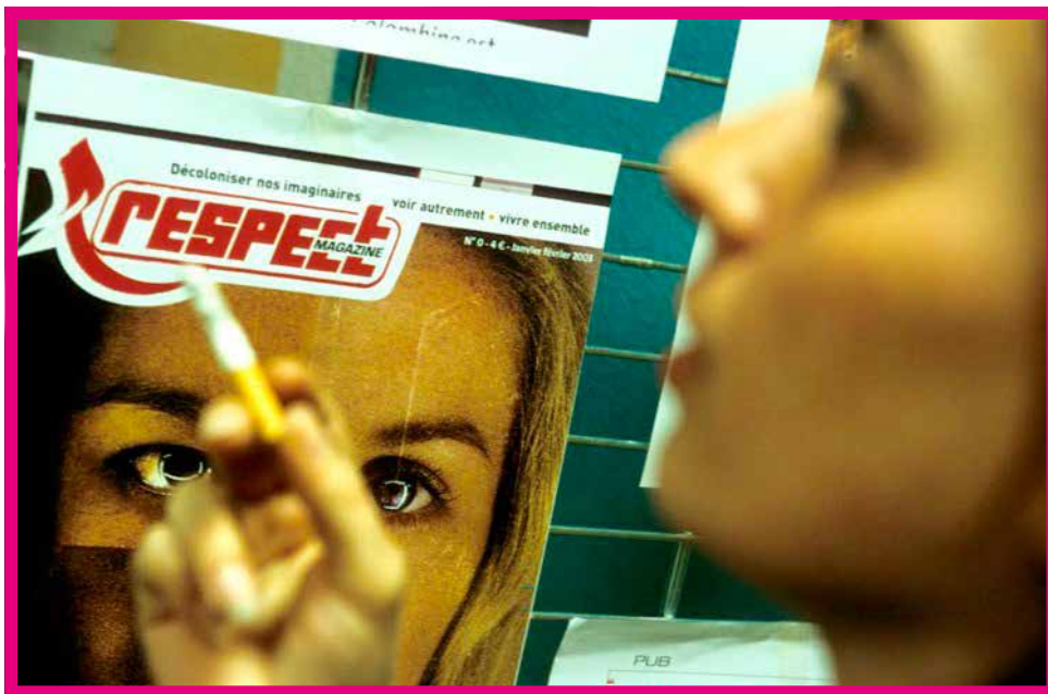
Nom de l'œuvre - Pierre-Yves Ginet

reportages réalisés dans vingt pays, Pierre-Yves Ginet a composé un fond photographique unique, témoignage de combats de femmes méconnues, œuvrant seules - ou aux côtés d'hommes -, pour leur survie, la démocratie, la justice et le respect des droits fondamentaux de toutes et tous. Ses expositions ont été vues par plus de 700 000 personnes. Il est l'auteur du livre "Femmes en résistance" (Ed Verlhac - 2009).