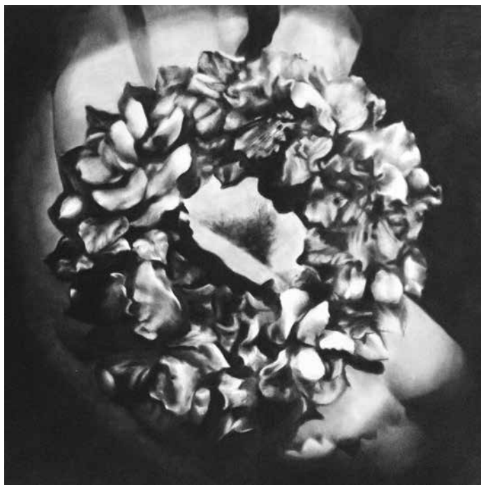
Nom de l'œuvre - Damien Moulierac